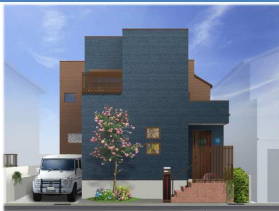
※イメージバスの為、実際と異なる仕上がりになる場合があります。

◆冬暖かく夏涼しい高性能ハイブリッド窓採用 『防火戸FG-L』(アルミ樹脂のハイブリッド構造・優れた断熱)