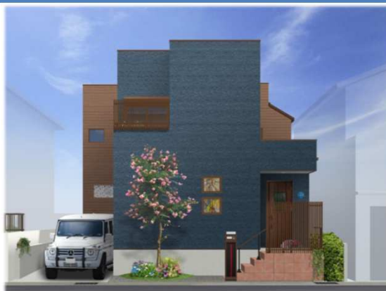
※イメージバースの為、実際と異なる仕上がりになる場合があります。