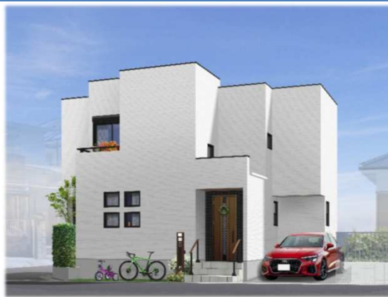
※イメージバスの為、実際と異なる仕上がりになる場合があります。

◆冬暖かく夏涼しい高性能ハイブリッド窓採用 『サーモスL』(アルミ樹脂のハイブリッド構造・優れた断熱性)