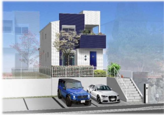
※イメージパースの為、実際と異なる仕上がりになる場合があります。