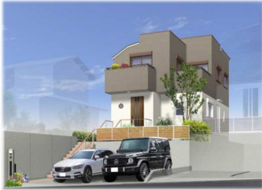
※イメージパースの為、実際と異なる仕上がりになる場合があります。