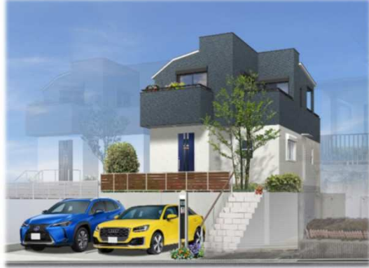
※イメージパースの為、実際と異なる仕上がりになる場合があります。