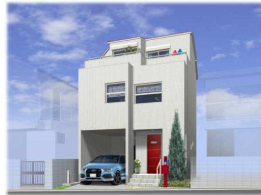
※イメージパースの為、車庫スペースと車のイメージ及び外観が実際と異なる仕上がりになる場合があります。

◆充実の防火性能で安心安全と快適さを両立した『エピソードII 防火窓GNEO』（網入複層ガラス・クリアネット採用）