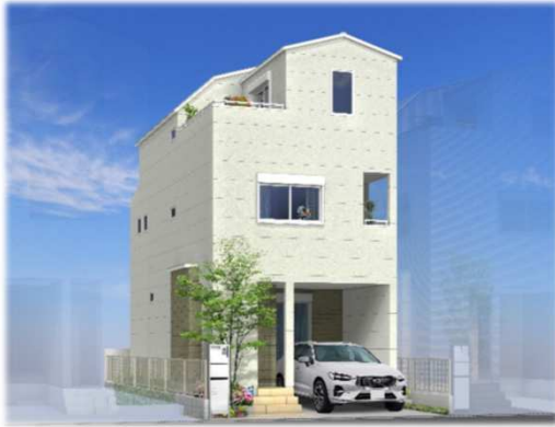
※イメージパースの為、車庫スペースと車のイメージ及び外観が実際と異なる仕上がりになる場合があります

◆充実の防火性能で安心安全と快適さを両立した『エピソードII 防火窓GNEO』(網入複層ガラス・クリアネット採用)