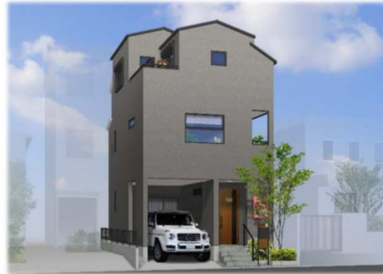
※イメージベースの為、車庫スペースと車のイメージ及び外観が実際と異なる仕上がりになる場合があります

◆充実の防火性能で安心安全と快適さを両立した『エピソードII 防火窓GNEO』（網入複層ガラス・クリアネット採用）