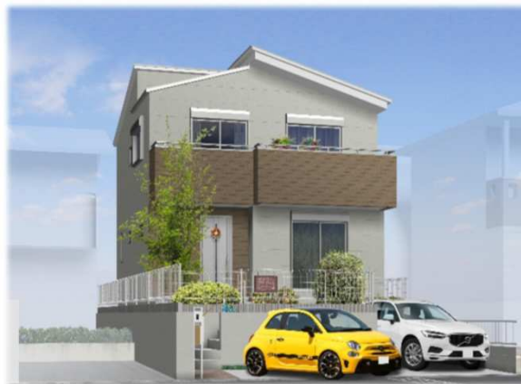
※イメージパースの為、車庫スペースと車のイメージ及び外観が実際と異なる仕上がりになる場合があります。