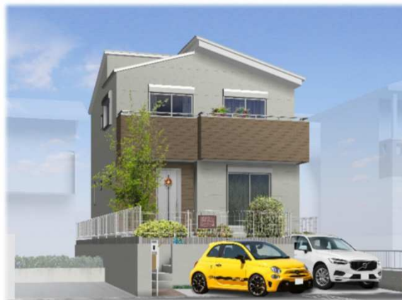
※イメージパースの為、車庫スペースと車のイメージ及び外観が実際と異なる仕上がりになる場合があります。